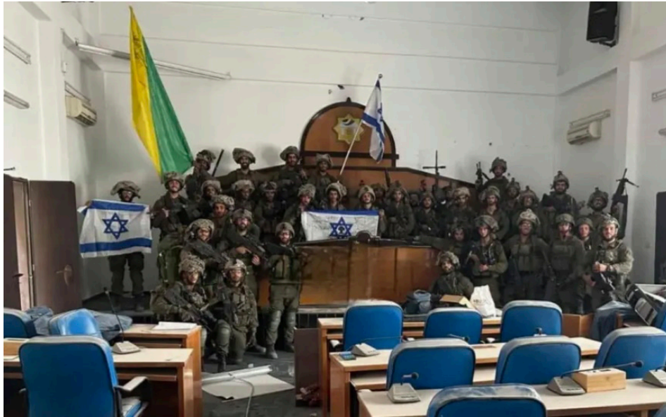
חיילי גולני, לאחר שהשתלטו על הפרלמנט של חמאס בעזה (התמונה נלקחה מתעוד ברשתות החברתיות לפי סעיף 27א' לחוק זכויות יוצרים)