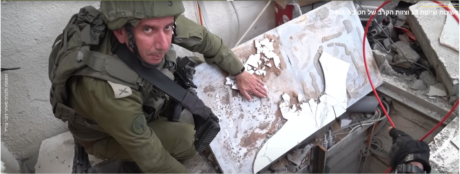
בתמונה: תת אלוף דניאל הגרי, דובר צה"ל, מציג ממצאים שהתגלו מתחת לבית חולים שיפא בעזה