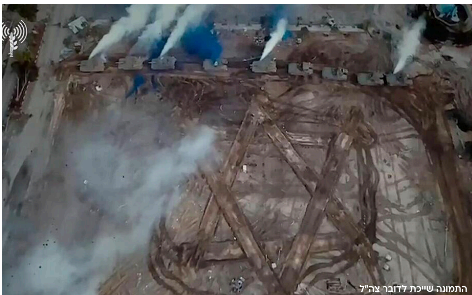
התמונה שייכת לז'ורנל "צה"ל