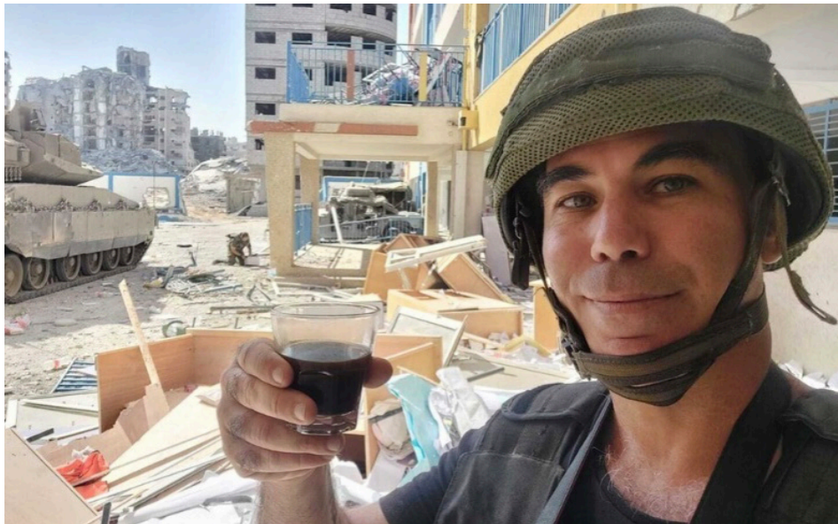
עיתונאי ישראלי שותה קפה בחורבות העיר עזה